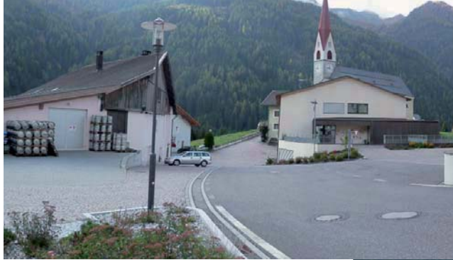
Platz vor Schule, Kindergarten und Vereinshaus vor Gestaltung