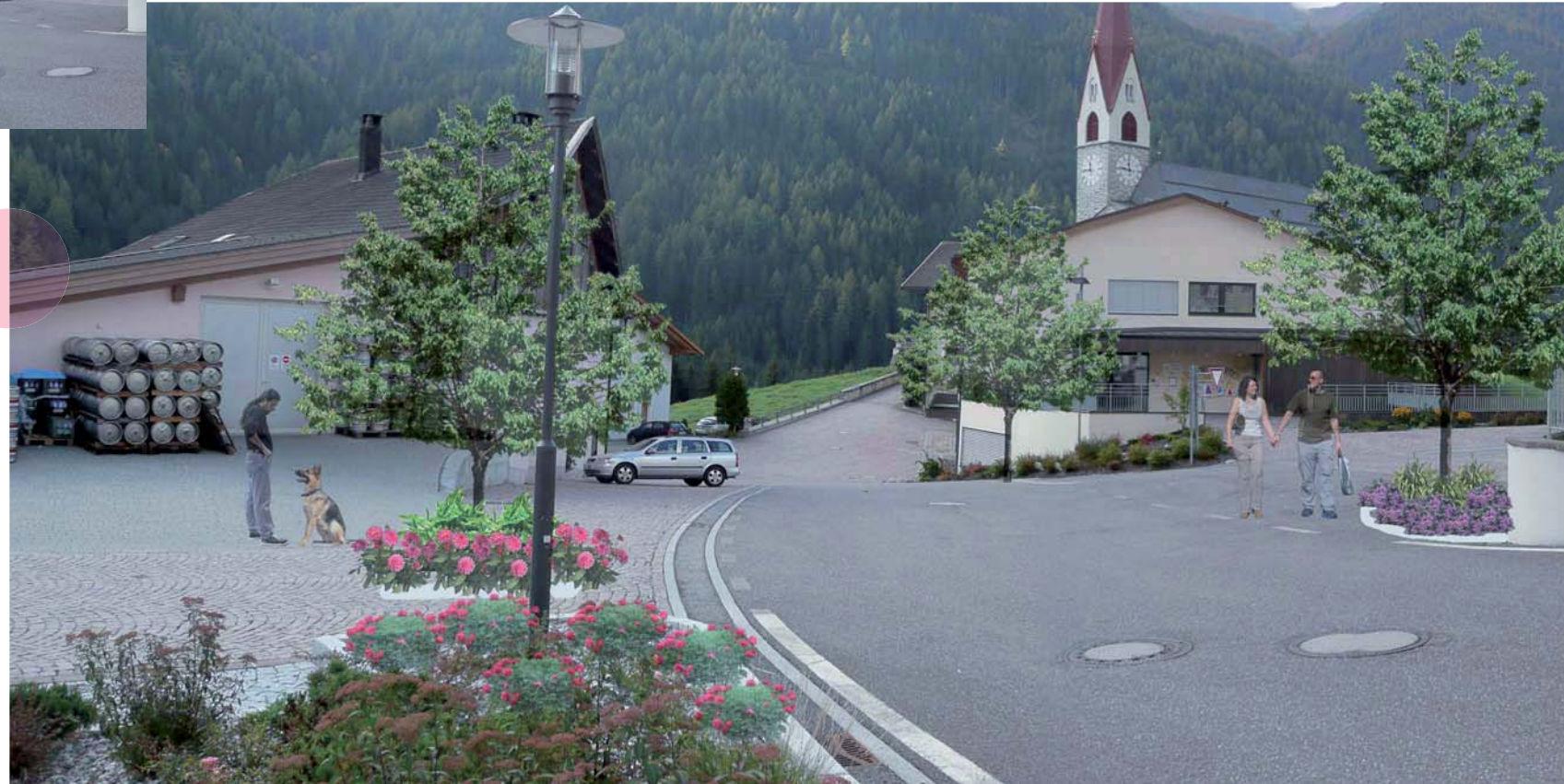
Blick Richtung Gemeinde vor Gestaltung