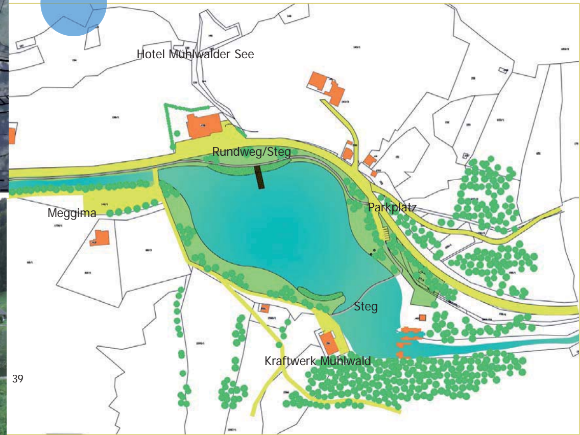
Mühlwald Stausee Bestand