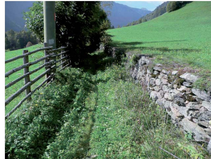
Alter Flurweg Kreuzwirt Grossgasteiger

Durch die intensive Labnutzung wirkt die landwirtschaftliche Fläche wie ein Park